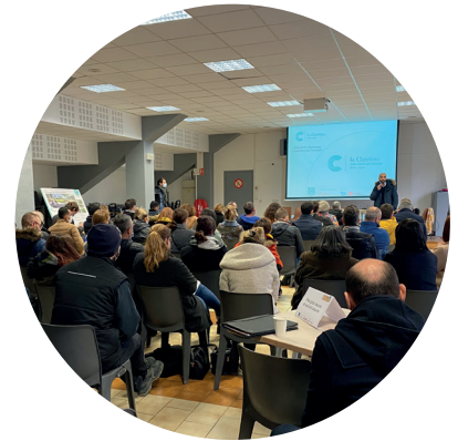
Lundi 29 novembre 2021 : Évènement « 60 000 heures d'insertion par l'emploi pour la Clairière »