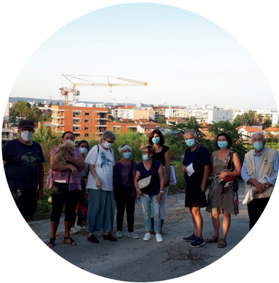
Mercredi 8 septembre 2021 : visite de chantier