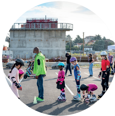
Samedi 2 octobre 2021 : la Clairière en roues libres